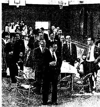
和気あいあいの懇親会風景