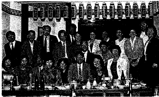
新山会(池袋海鮮問屋にて)