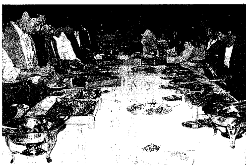
乾盃につづいて食べくらべ

年かたつて、向丘へ行つて本当に良かったなと言えらるだろうと信じたい。そのためにも頑張つて、悔いの残らないように生きて行きたい。とにかく、今は向丘に行つてよかつたと思つている。